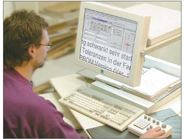
Spezielle Zusatz-Hardware erlaubt die Wiedergabe von stark vergrößerten Texten auf dem Bildschirm

Eine klar strukturierte Navigation erleichtert den Besuchern die Orientierung auf der